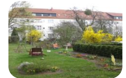
Magdeburg Stadtfeld Ost