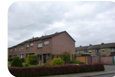
Herzogenrath - Merkstein